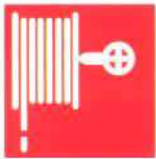
SYMBOOL BRANDSLANG HASPEL