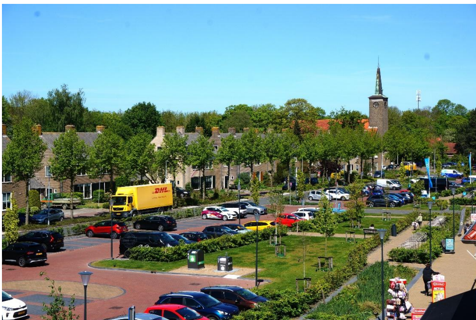
Overzicht winkelstraat Wieringerwerf met de kerk op de achtergrond

Alle dorpen hebben bedrijfsvestigingen in de agrarische sector, maar daarnaast is er sprake van groeiende investeringen. De Wieringermeerpolder is onderdeel van de gemeente Hollands Kroon.