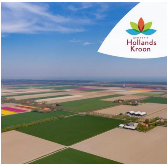
Wieringermeer vanuit de lucht