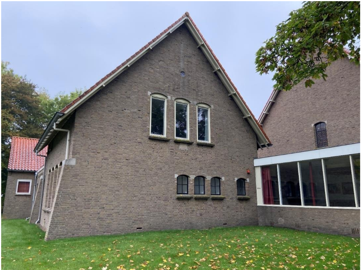
De linkerzijgevel van de vergaderzaal