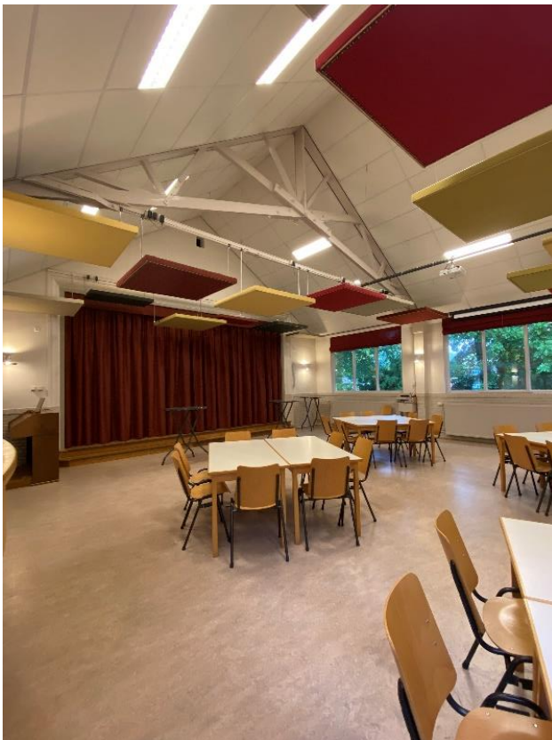
De toneelzaal, gerealiseerd in 1954.