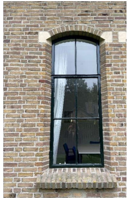
De achtergevel van de vergaderzaal en een detailfoto van het raamkozijn.