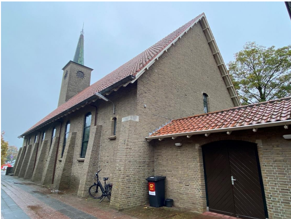
De achtergevel van de kerkzaal.

In de achtergevel van de toneelzaal bevinden zich twee houten raamkozijnen met middenstijl. De raamkozijnen worden beëindigd door een hanenkam. De topgevel wordt beëindigd door een rollaag en een kantpan.