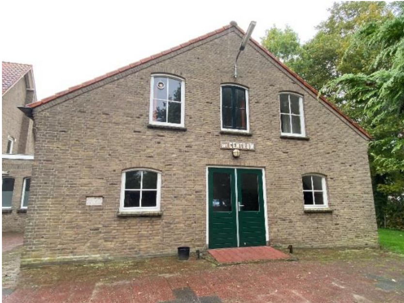
De voorgevel van de vergaderzaal, het tussenlid en de toneelzaal.