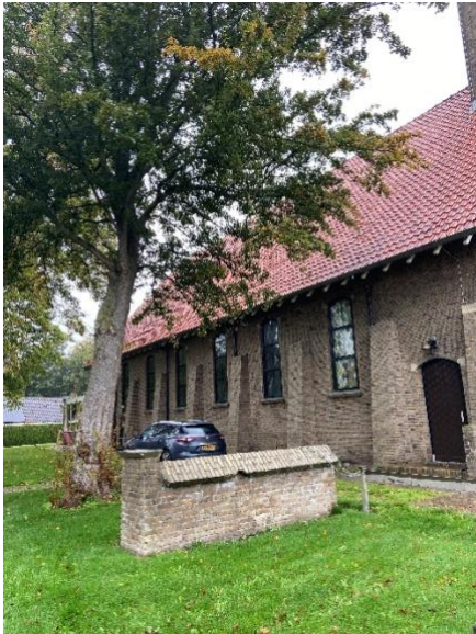
De omgeving van het monument