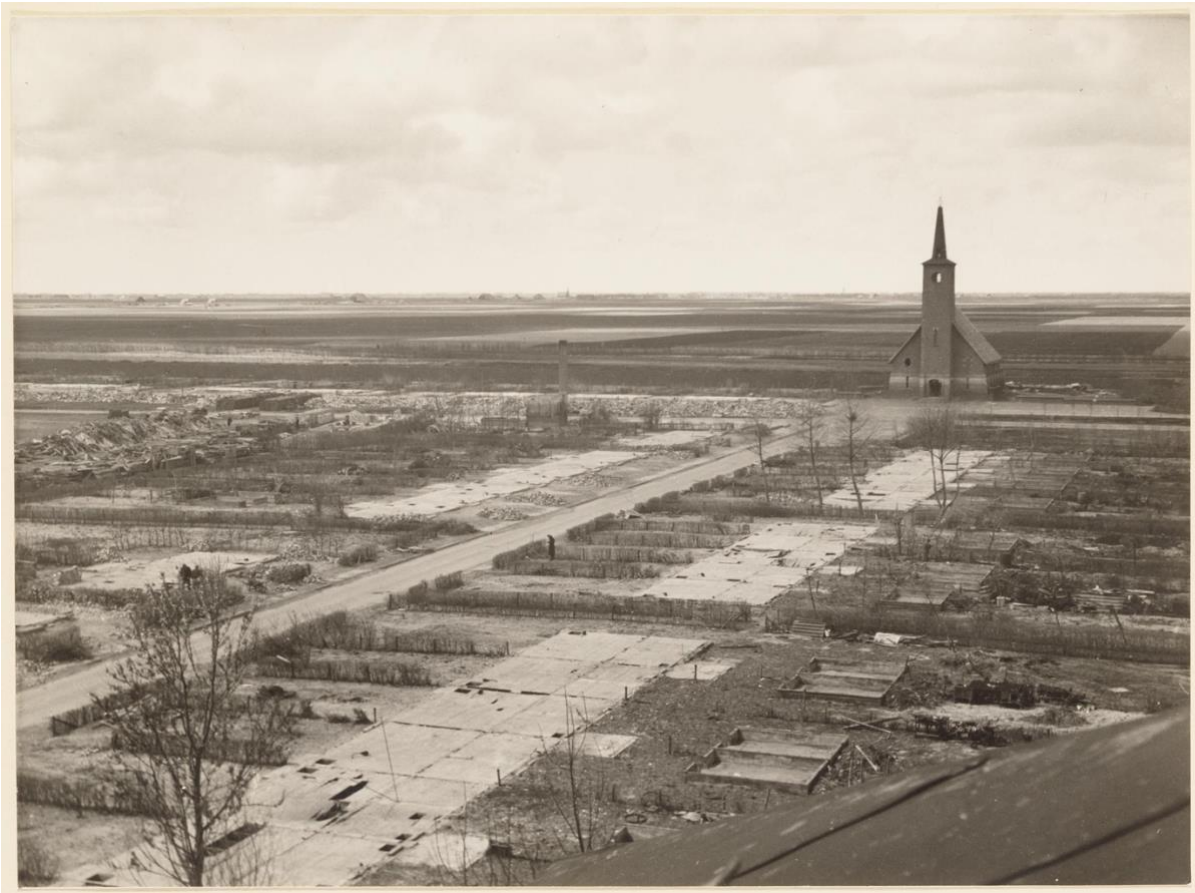
Zomer 1946: Het puin in de Meeuwstraat te Wieringerwerf is geruimd.