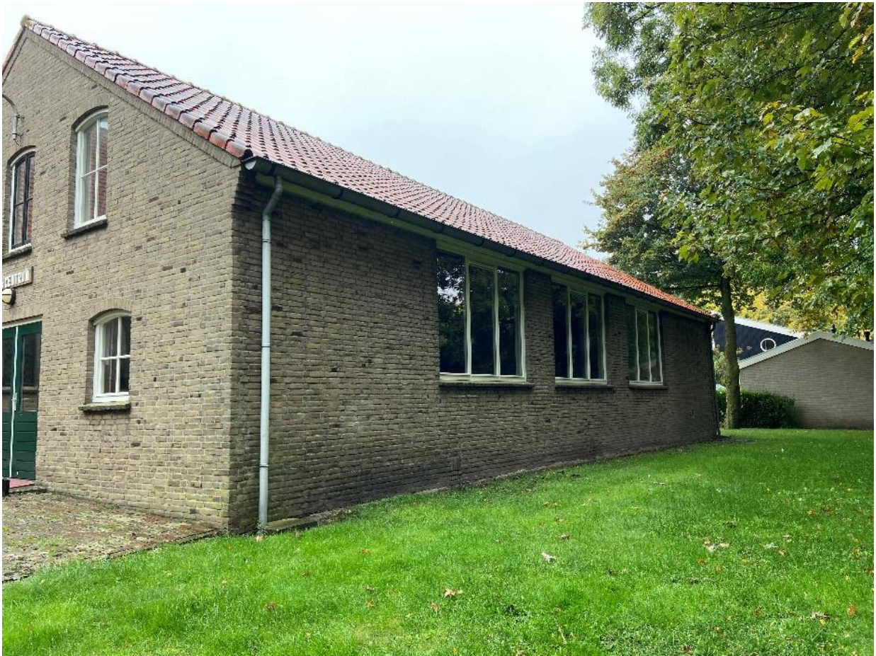
De rechterzijgevel van de toneelzaal.