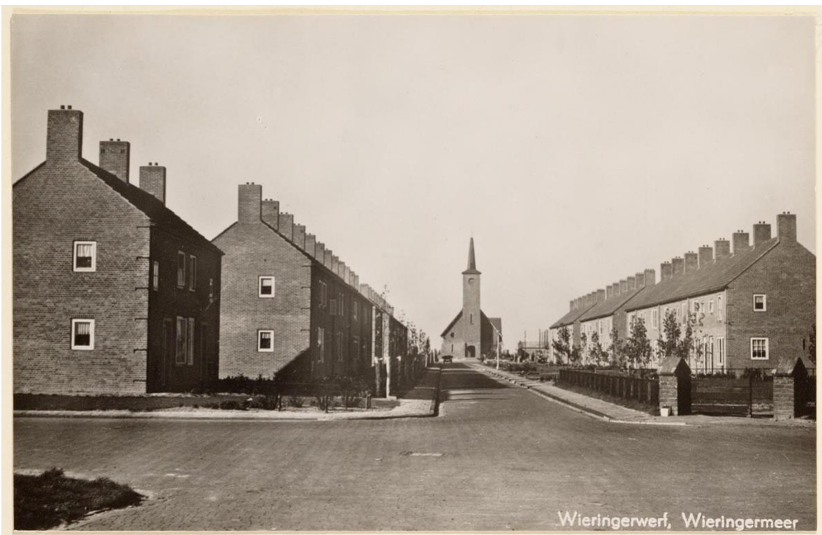
Zicht vanaf de Meeuwstraat op de Gereformeerde kerk. Datum zomer 1949.