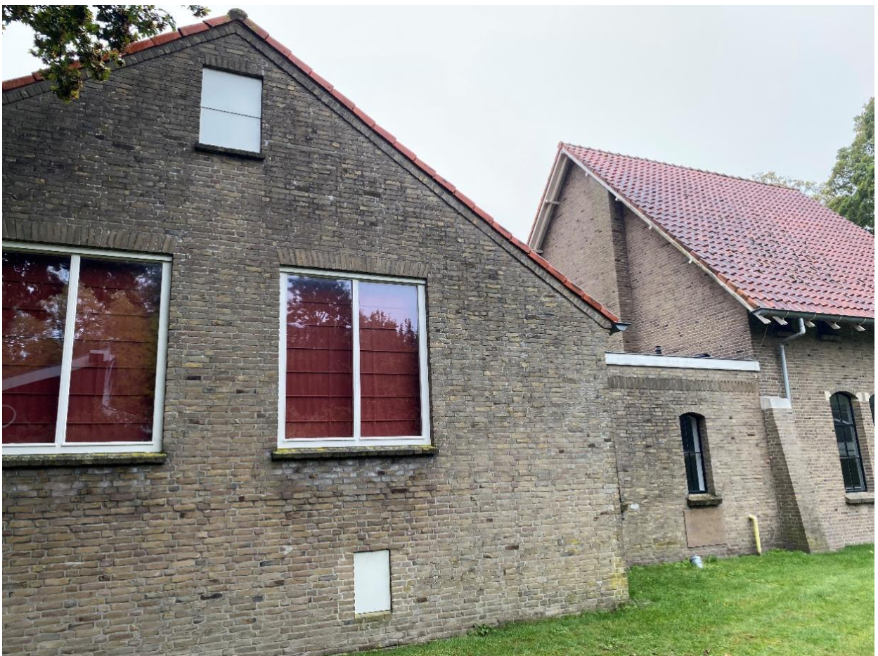
De achtergevel van de toneelzaal en het tussenlid.