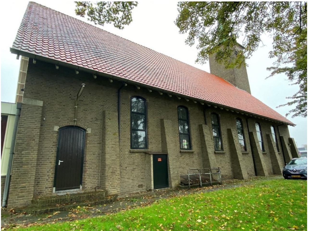
De linkerzijgevel van de kerkzaal

De linkerzijgevel van de vergaderzaal heeft op de begane grond vier vierruits getoogde vensters van staal. Op de eerste verdieping bevinden zich drie rechthoekige houten kozijnen, deze zijn vernieuwd. De oorspronkelijke getoogde vensters zijn daarbij vervangen. De vensters worden afgesloten door een rollaag met aanzetstenen. De gevel wordt afgesloten door het houten dakoverstek.